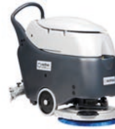
SC450 Ekonomik, dayanıklı ve kullanımı kolay