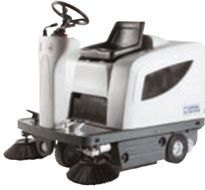
SR 1101 Etkili süpürme, düşük işletme gideri