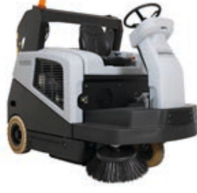
SW5500 Endüstriyel temizlikte hybrid teknolojisi