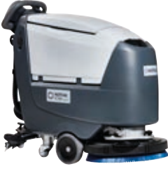
SC500 Dünyanın, suyu en verimli kullanan makinesi