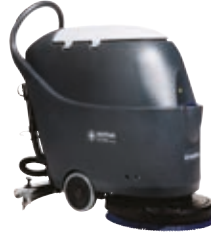
SC430 Kullanımı basit güven veren temizlik performansı