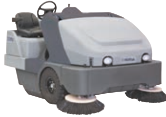
SW8000 Geniş alanların süpürülmesi için ideal. Suyla toz kontrolü özelliği