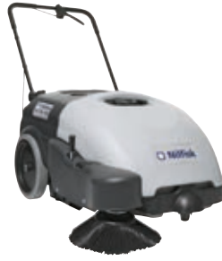
SW 750 Sessiz ve kolay temizlik