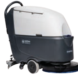
SC530/SC530D Sürüş motorlu veya sürüş motorsuz, tercih sizin!