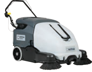
SW900 İster akülü ister benzinli süpürme