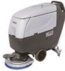
BA/CA 551 Düşük maliyetli temizlik için akıllı tasarım