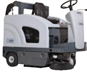
SW4000 Mükemmel performans ile daha az toz