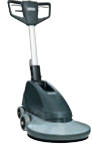
BU500 Geniş alanlarda parlak yüzeyler için