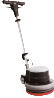
PS 333A Küçük alanlar için kompakt makine