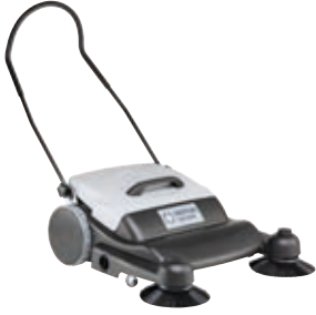
SM 800 Elle süpürmede çift fırça