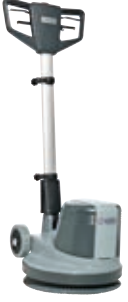
FM400 L/H Yeni nesil, tek diskli