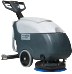
SC400 Ekonomik, kullanımı kolay, küçük ve özelliği