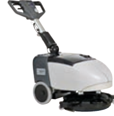
SC351 Küçük alanların büyük makinesi