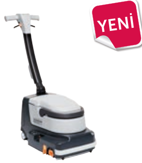
SC250 En dip köşeleri bile tek geçişte süpürür, yıkar ve kurutur